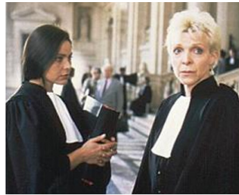
1996 POUR RIRE de Lucas Belvaux avec Tonie Marshall