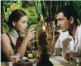
1977 LES NOUVEAUX MONSTRES (I nuovi mostri) de Mario Monicelli avec Yogo Voyagis