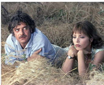
1979 AVEUX SPONTANÉS (La Vita è bella) de Grigori Tchoukhraï avec Giancarlo Giannini