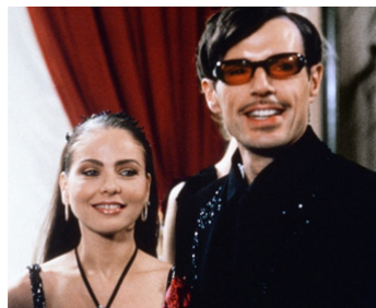
2000 JET SET de Fabien Onteniente avec Lambert Wilson