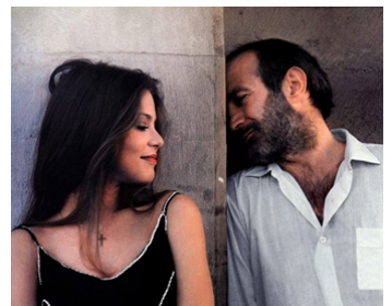
1981 CONTE DE LA FOLIE ORDINAIRE (Storie di ordinaria follia) de M. Ferreri avec Ben Gazzara