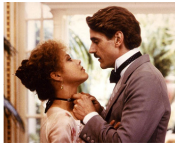
1984 UN AMOUR DE SWANN de Volker Schlöndorff avec Jeremy Irons