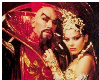
1980 FLASH GORDON (Flash Gordon) de Mike Hodges avec Max von Sydow