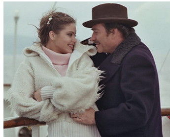
1978 DERNIER AMOUR (Primo amore) de Dino Risi avec Ugo Tognazzi