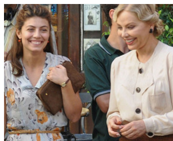
2012 TO ROME WITH LOVE de Woody Allen avec Alessandra Mastronardi