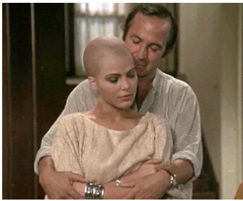
1983 LA FILLE DE TRIESTE (La ragazza di Trieste) de Pasquale Festa Campanile avec Ben Gazzara