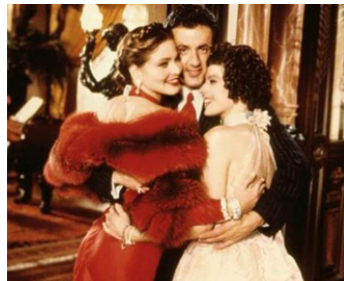
1991 L'EMBROUILLE EST DANS LE SAC (Oscar) de John Landis avec S. Stallone, Marisa Tomei