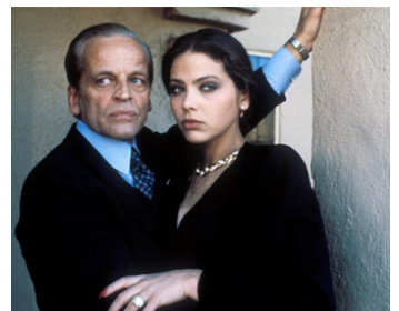
1982 LES ARMES DU POUVOIR (Love and Money) de James Toback avec Klaus Kinski