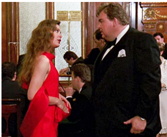
1992 BANCO POUR UN CRIME (Once upon a Crime) d'Eugene Levy avec John Candy