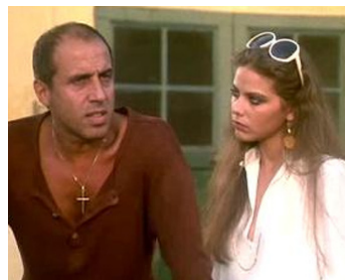
1980 LE VIEUX GARÇON (Il Bisbetico domato) de F. Castellano & G. Moccia avec A. Celentano