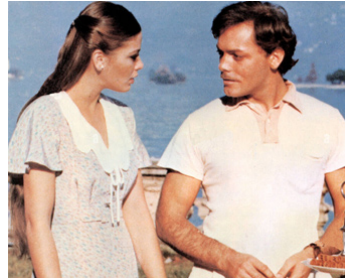
1977 LA CHAMBRE DE L'ÉVÊQUE (La Stanza del vescovo) de Dino Risi avec Patrick Dewaere