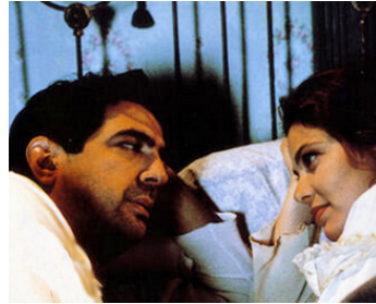
1989 BANDINI (Wait until Spring, Bandini) de Dominique Derudderre avec Joe Mantegna