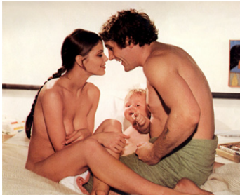
1976 LA DERNIÈRE FEMME (L'ultima Donna) de Marco Ferreri avec Gérard Depardieu