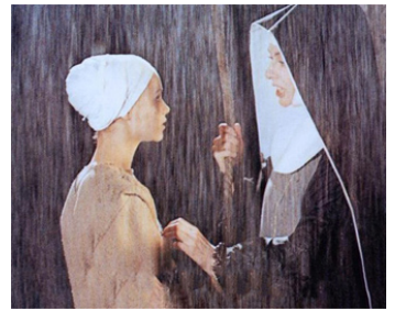
1973 LE MONACHE DI SANT'ARCANGELO de Domenico Paolella avec Anne Heywood