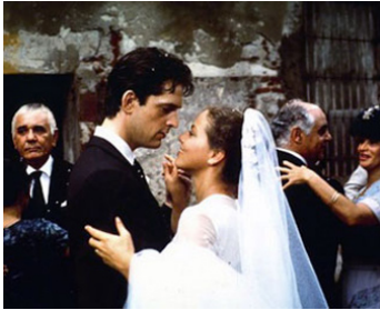
1987 CHRONIQUE D'UNE MORT ANNONCÉE de Francesco Rosi avec Rupert Everett