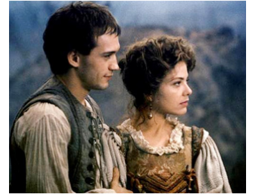
1990 LE VOYAGE DU CAPITAINE FRACASSE d'Ettore Scola avec Vincent Pérez