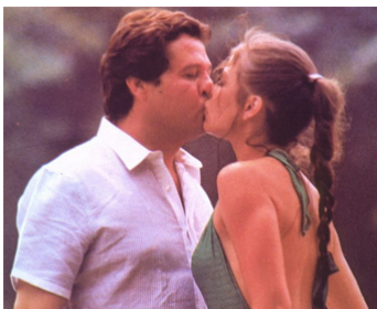
1981 PERSONNE N'EST PARFAIT (Nessuno è perfetto) de P. Festa Campanile avec R. Pozzetto