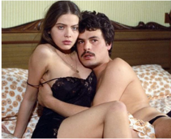
1974 ROMANCES ET CONFIDENCES (Romanzo popolare) de Mario Monicelli avec M. Placido