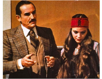
1976 VIRGINITÉ (Come una rosa al naso) de Franco Risi avec Vittorio Gassman