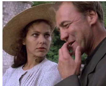
1991 LE DIMANCHE DE PRÉFÉRENCE de Giuseppe Bertolucci avec Bruno Ganz