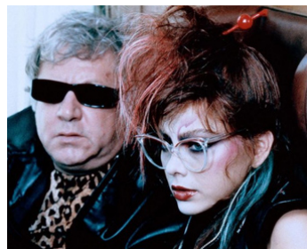
1982 LES AVENTURES DE MISS CATASTROPHE (Bonnie et Clyde all'italiana) de Steno avec P. Villaggio