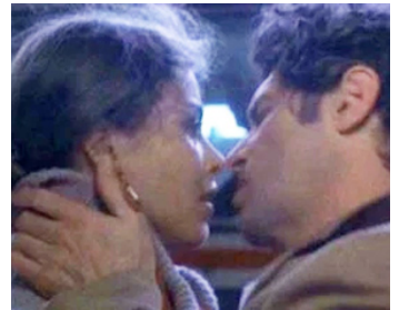
1978 EUTANASIE D'UN AMOUR (Eutanasia di un amore) d'Enrico Maria Salerno avec Tony Musante