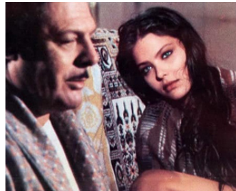
1978 MÉLODIE MEURTRIÈRE (Giallo napoletano) de Sergio Corbucci avec Marcello Mastroianni