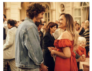
2018 NUITS MAGIQUES (Notti magiche) de Paolo Virzi avec Giovanni Toscano