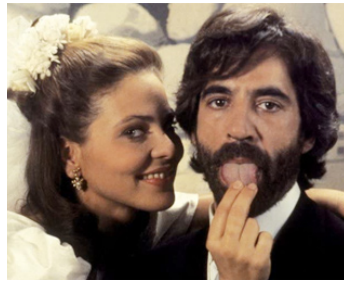
1993 L'AMANT BILINGUE (El Amante bilingüe) de Vicente Aranda avec Imanol Arias