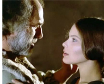
1975 LÉONOR (Leonor) de Juan Luis Buñuel avec Michel Piccoli