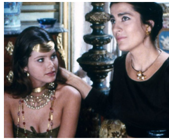
1971 MEURTRE PAR INTÉRIM (Un posto ideale per uccidere) d'Umberto Lenzi avec Irène Pappas