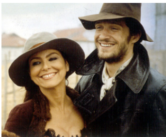
2000 TERRE DE FEU (Terra de Fuego) de Miguel Littin avec Claudio Santamaria