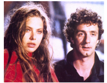
1987 STREGATI (Stregati) de Francesco Nuti avec Francesco Nuti