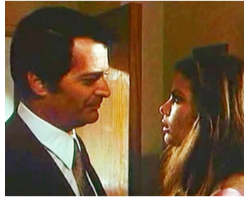
1974 UNA CHICA Y UN SEÑOR de Pedro Masó avec Sergio Fantoni