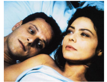
1998 L'INCONNU DE STRASBOURG de Valeria Sarmiento avec Charles Berling