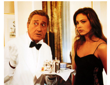
1991 VACANCES DE NOËL (Vacanze di Natale '91) d'Enrico Oldoini avec Alberto Sordi